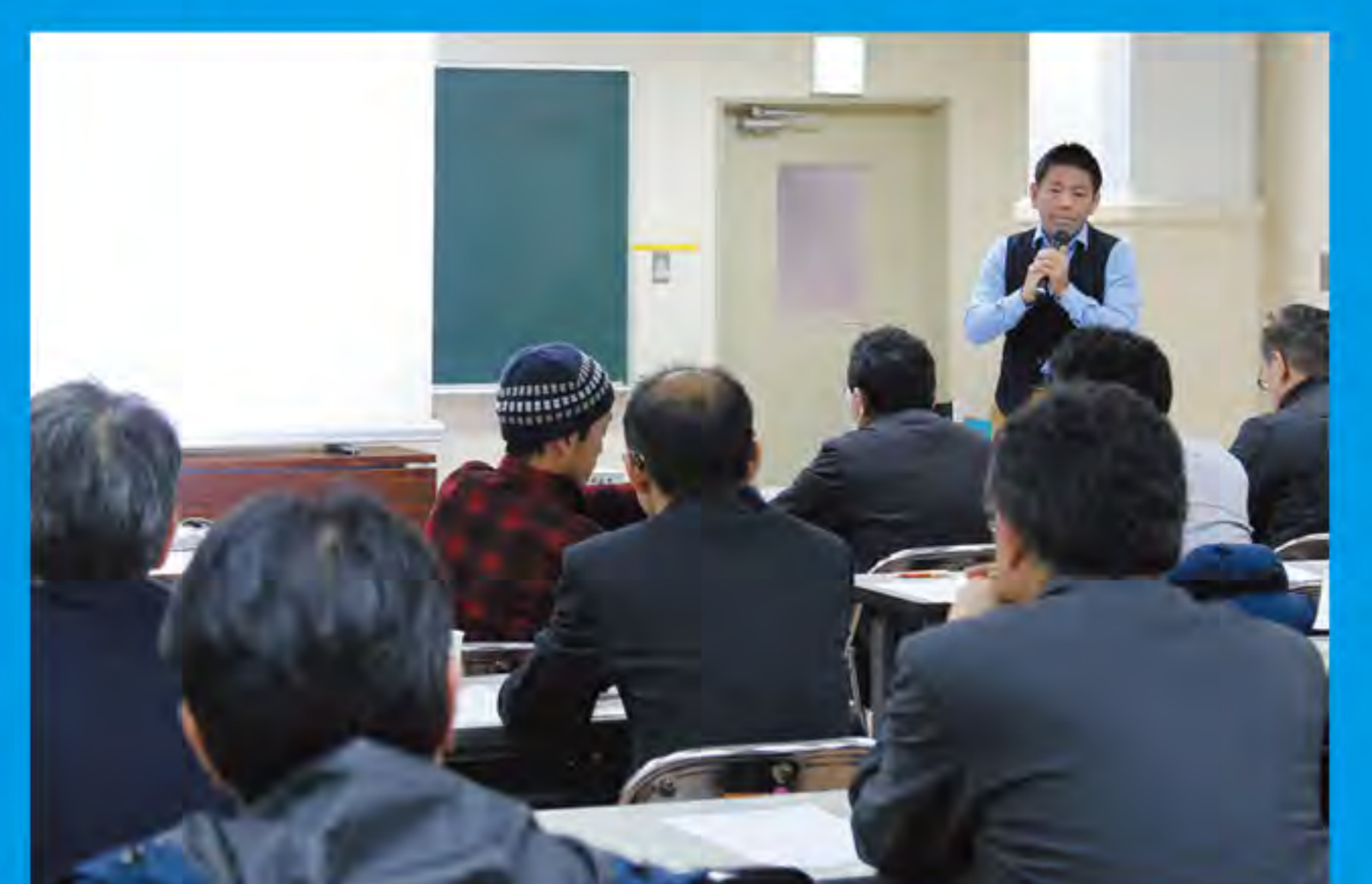
「断熱住宅」についての勉強会

▼ヨーロッパでも日本でも温暖な地域の人々が冬季にヒートショックで健康を害する状況があります。流行語にも選ばれた「災害級の暑さ」でも南国のビックリする寒さでも、たとえライフラインが途絶えても快適に過ごせる住まいが健康維持のために必要です。建物の熱は窓からの出入りが最大なので、窓の外につけるブ